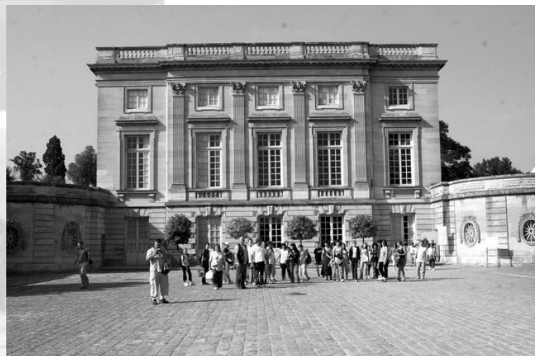
Kis Trianon előtt