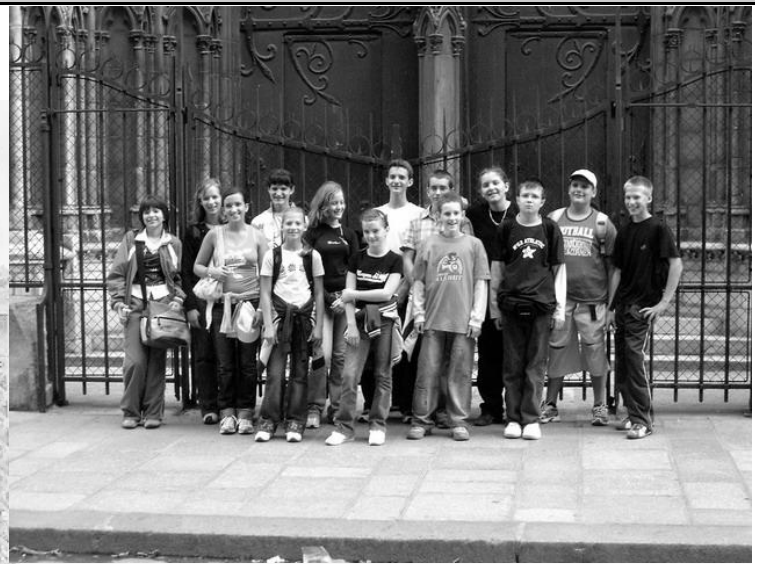
A gyerekek a Notre-Dame oldalkapujánál

foglalkozott a francia főváros nevezetességeivel, közlekedésével, szeptemberi kulturális eseményeivel azért, hogy erre az öt napra otthon