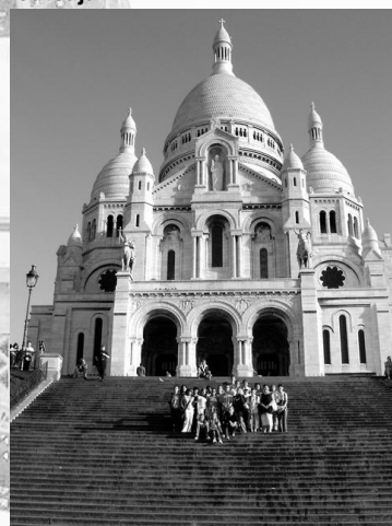
A Sacré-Coeur lépcsőin

3. Nap: Disneyland. Amikor odaértünk esni kezdett, és úgy tűnt, hogy ez így is marad. Szerencsére kegyes volt hozzánk az ég, és mire a vadnyu-